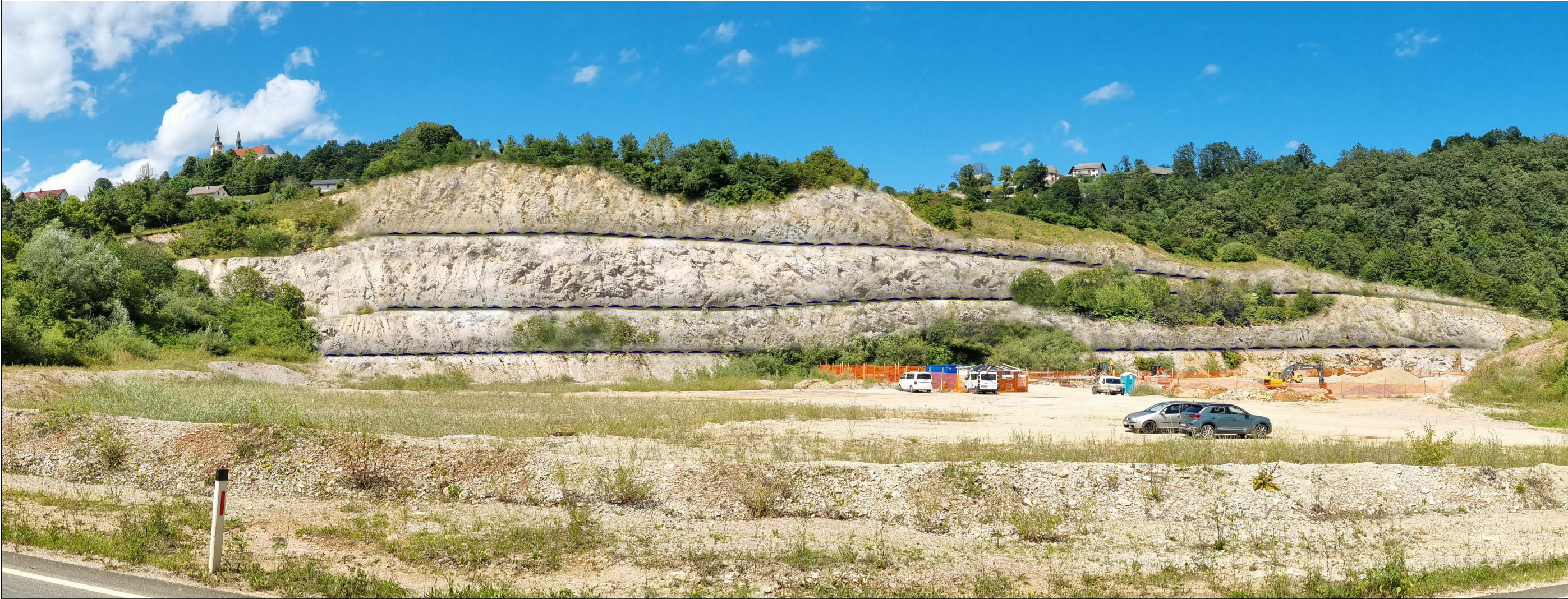
Pogled 1 - Vizualizacija predlaganih rešitev z vstopa v opuščeni kamnolom.